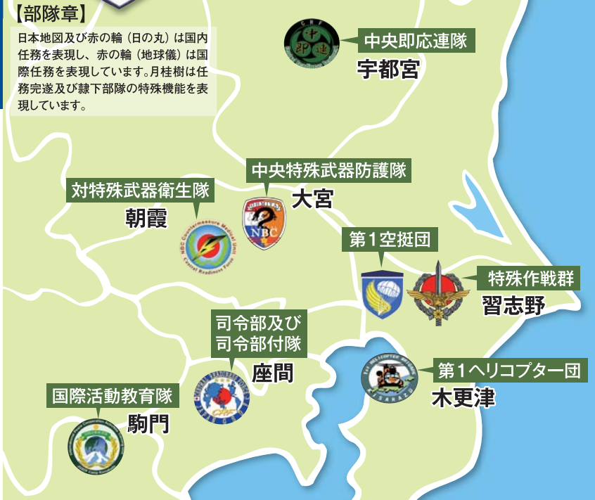
中央即応集団司令部庁舎